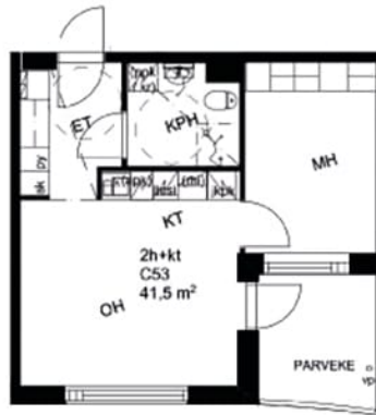
Magneettikatu 10 C 62 / Pohjakuva Ei mittakaavassa