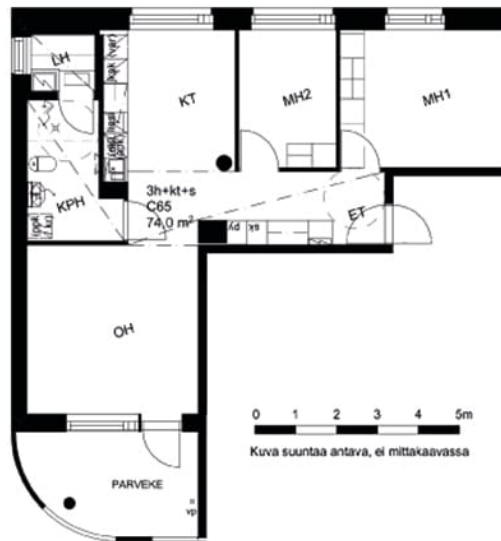
Magneetikatu 10 C 65 / Pohjakuva Ei mittakaavassa