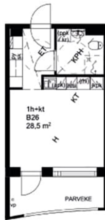
Magneetikatu 10 B 26 / Pohjakuva Ei mittakaavassa

0 1 2 3 4 5m Kuva suuntaa antava, ei mittakaavassa