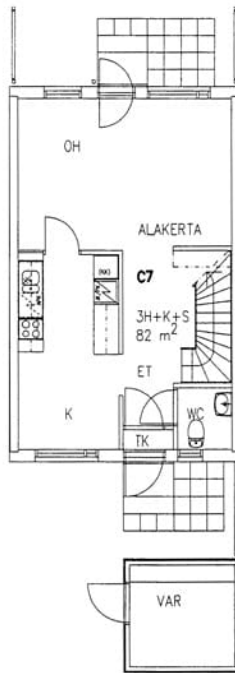
Lindalintie 25 C 7 / pohjakuva 1. kerros Not in scale