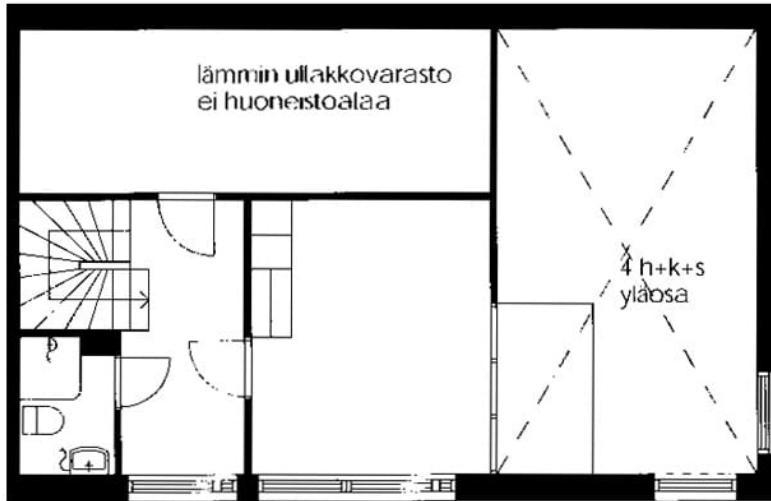
Proomukatu 3 A 28 / pohjakuva 2. kerros Ei mittakaavassa