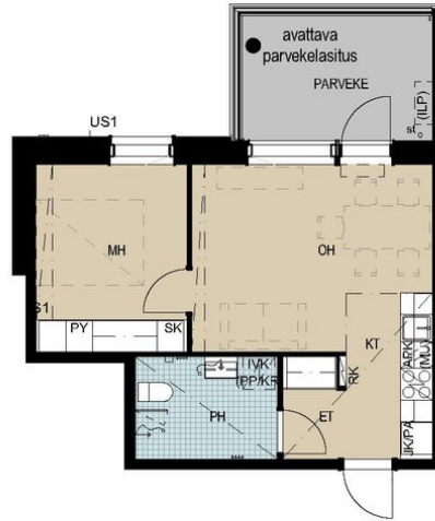
Bäckströminkatu 1 A 10 / 2H+KT+PARVEKE, 37,0 m 2 _01,10,18,26.jpg