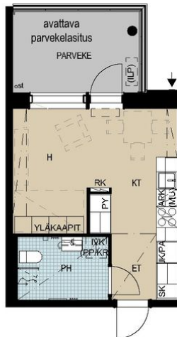
Bäckströminkatu 1 A 9 / 1H+KT+PARVEKE, 26,0 m 2 _09.jpg